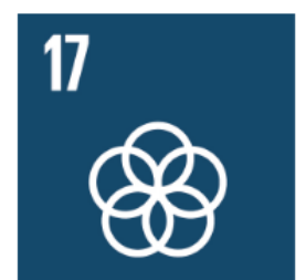
17 Genomförande och globalt partnerskap