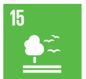
15 Ekosystem och biologisk mångfald