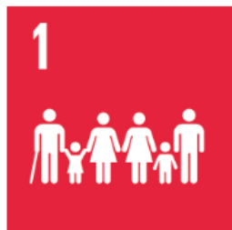
1 Ingen fattigdom