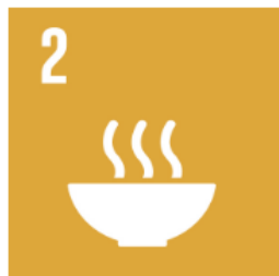
2 Ingen hunger