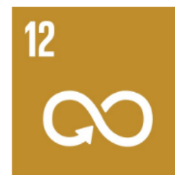
12 Hållbar konsumtion och produktion