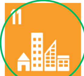
11 Hållbara städer och samhällen