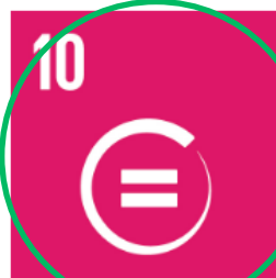
10 Minskad ojämlikhet