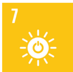
7 Hållbar energi för alla