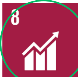
8 Anständiga arbetsvillkor och ekonomisk tillväxt